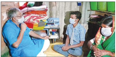
ಎಸ್‌ಸೆಲ್ ಪರೀಕ್ಷೆ ಗುಡಿಸಲಿಗೆ ಶಿಕ್ಷಣ ಸಚಿವರ ಭೇಟಿ